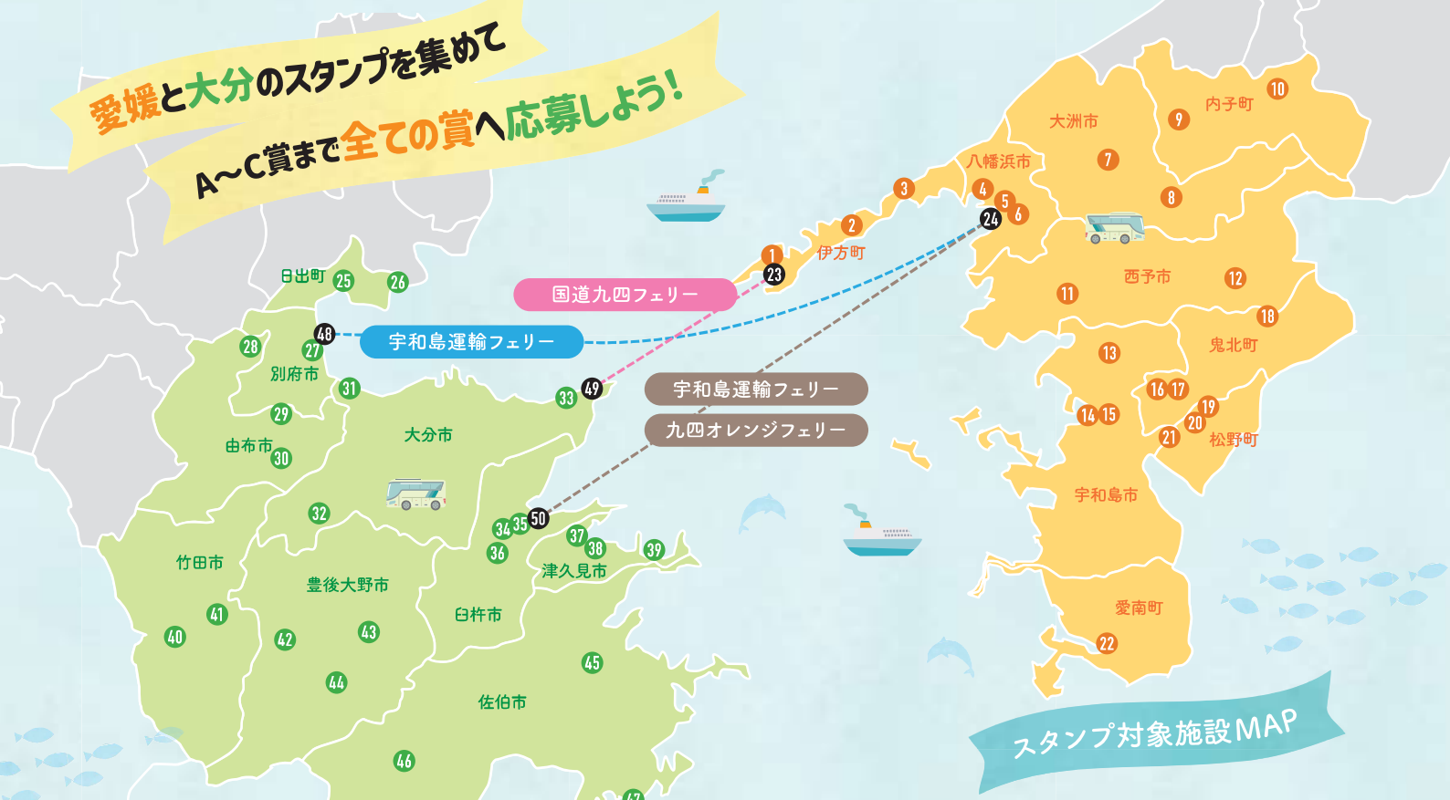
スタンプ対象施設MAP